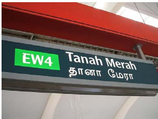
Tanah Merah 駅

空港からの電車は Tanah Merah 駅の中央に到着。両側の扉が開きます。市内へ行く場合は、進行方向に向かって左側のホームへ降ります。このホームには Joo Koon 行き、To City のサインが出ています。