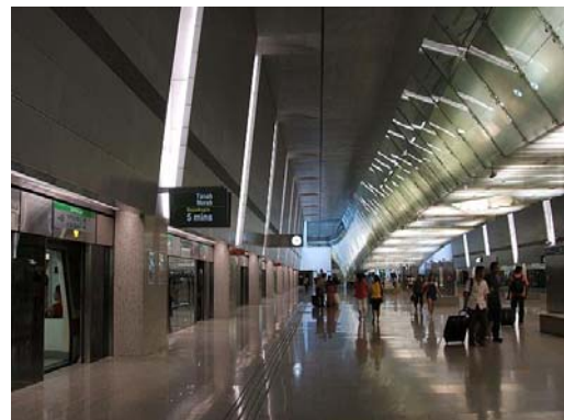
駅ホームも広々です。