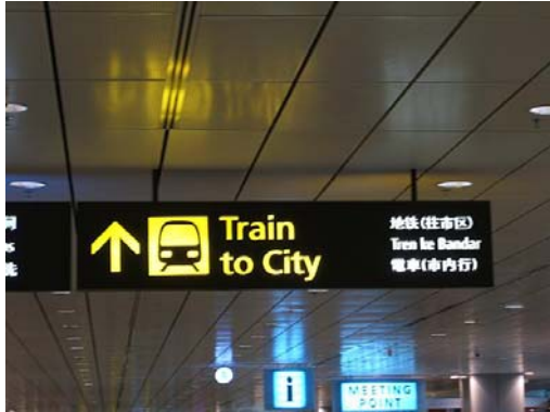
この矢印に従いすすむと、

到着ロビーのところにあるサイン「Train to City」の案内にそっていくと、Changi Airport 駅へ到着します。 駅のホームに到着する電車は全て 2 駅先にあるインターチェンジ(乗り換え駅)の Tanah Merah(タナメラ)駅行きです。